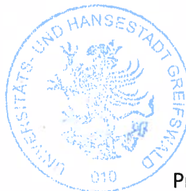
Egbert Liskow Präsident der Bürgerschaft

Friedhofs und Friedhofsgebührensatzung der Universitäts und Hansestadt Greifswald für die kommunalen Friedhöfe - Lesefassung öffentlich