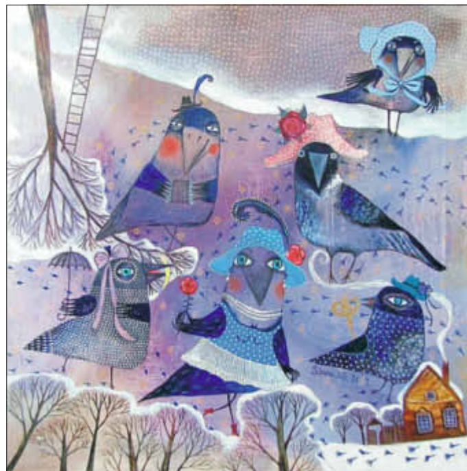
Familie Rabe von Anna Silivonchik

Die bildende Kunst der Republik Belarus (Weißrussland) steht seit langem in dem Ruf, moderne Kunst von besonders lebensfroher Art hervorzu-bringen. Erstmals wird nun eine zentrale Auswahl solcher Bilder, zusammengestellt von der Akademie der Künste des Landes, in Deutschland, in Greifswald vorgestellt. Im Pommernhus, Knopffstraße 1, können 42 Grafiken von 21 Künstlerinnen und Künstlern sowie die typischen und farbenfrohen Malereien der Künstlerin Anna Silivonchik betrachtet werden.