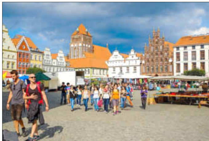
Auf dem Marktplatz, Foto: Thilo Adolph

Präsentiert werden die Ergebnisse einer Motivsuche, auf welche sich der Fotoclub Greifswald in den vergangenen Monaten begeben hat. Statt immer wieder aus ähnlicher Perspektive abgelichtete Touristenattraktionen der Stadt Greifswald festzuhalten, wandten sich die Fotografen nun verstärkt den Menschen der Stadt zu und stellten diese in den Mittelpunkt ihrer Arbeiten.