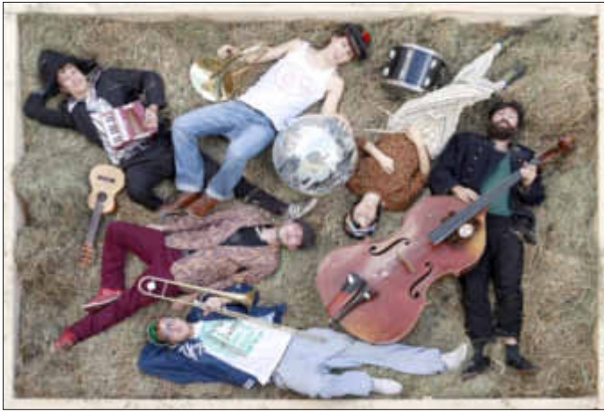
SkaZka Orchestra