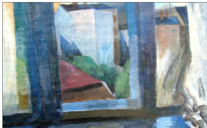
Blicke auf den Hinterhof, 1986

Noch bis zum 27. Februar zeigt das sozio-kulturelle Zentrum St. Spiritus die Ausstellung „Retrospektive Mechthild Hempel“. Anlässlich des 90. Geburtstages der Künstlerin Mechthild Hempel werden Teile ihres Werkes in der umfangreichen Ausstellung gezeigt.