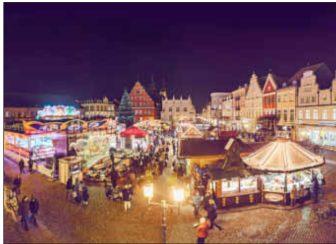
Blick auf den Weihnachtsmarkt

Auf dem Greifswalder Weihnachtsmarkt wird auch in diesem Jahr die hölzerne Adventskirche aufgebaut. Noch immer ist dieses Angebot der Kirche einzigartig im Land. Die Arbeit des Kapellenvereins, der das Kirchlein betreibt, erfährt bei Organisatoren und Gästen des Greifswalder Weihnachtsmarktes große Wertschätzung. Hans-Martin Harder und Roland Springborn vom Kapellenverein