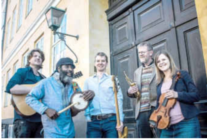
Himmerland, zu erleben bei der Folknacht am 7. Mai im Sozio-kulturellen Zentrum, Foto: Veranstalter

Dieses Jahr ist alles dabei: von den Publikumsmagneten Trad. Attack! bis zu Øystein Baadsvik, einem der besten Tubaspieler der Welt; von Danmarks Radio Bigband bis zum Blasorchester aus Munkedal; von geheimnisvollen Unterwassergeräuschen bis zu einer Ausstellung der weltberühmten Astrid Lindgren-Illustrationen von Ilon Wikland; von den punky Sounds des Powertrios Mopo bis hin zum Electro-Pop der isländischen