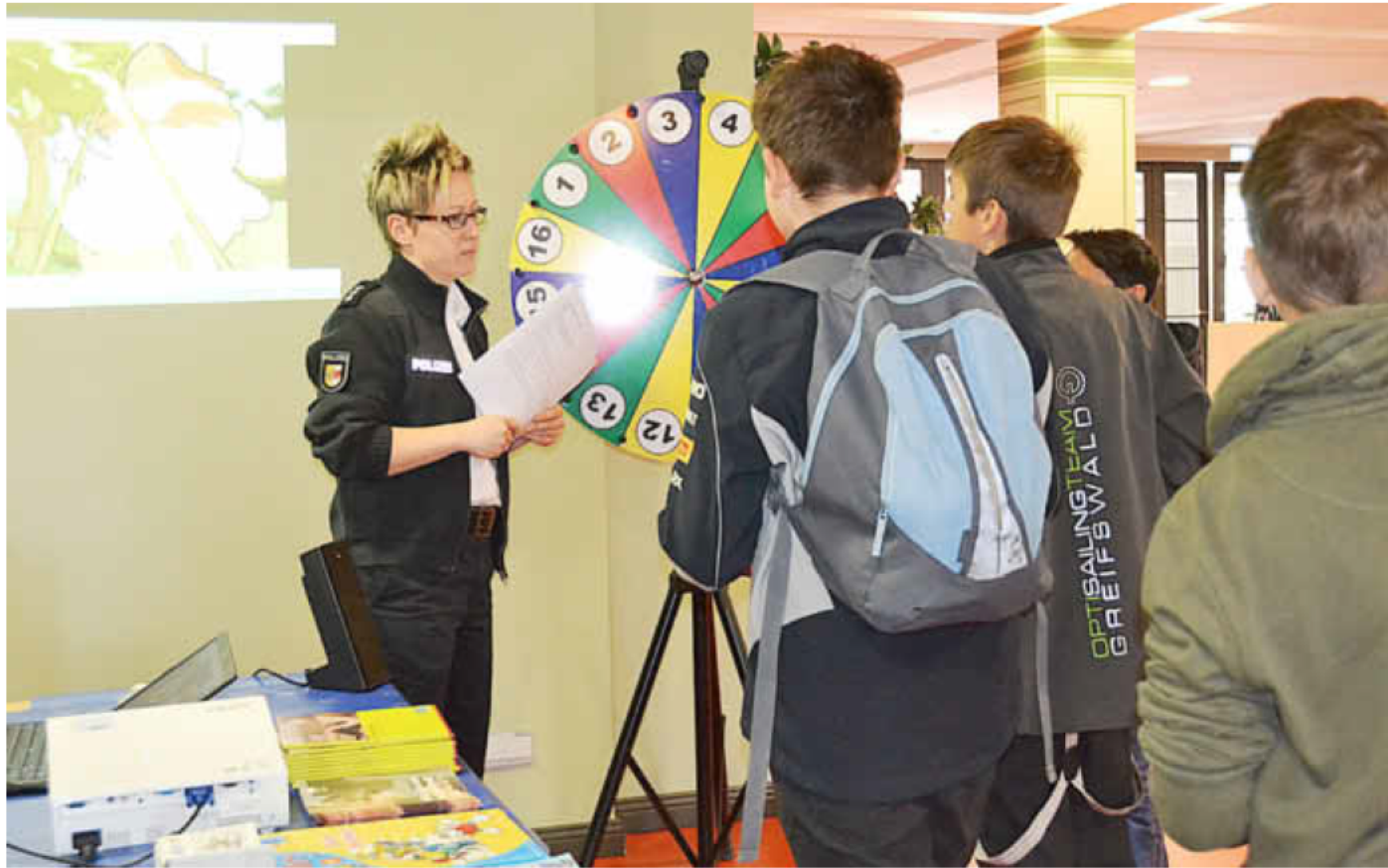
Wissen testen (Foto vom Präventionstag 2015, Elli Reimann)

Beim diesjährigen Präventionstag, am 4. Mai 2016, präsentieren Schulen, Vereine und Institutionen bereits zum 15. Mal ihre Projekte zu den Themen Sucht- und Gewaltprävention, aber auch Medienkompetenz und Integration. Von 9:00 bis 13:00 Uhr stellen die Mädchen und Jungen ihre Konzepte und Ergebnisse in der Stadthalle vor. Parallel dazu finden in verschiedenen Einrichtungen 35 Workshops zu 16 unterschiedlichen Themen statt. Beispielsweise erfahren die Jugendlichen hier mehr über „Cybercrime“ und „Recht im Internet“, „Wie Sucht entsteht und wie man sich schützen kann“. Unter dem Titel „Ich