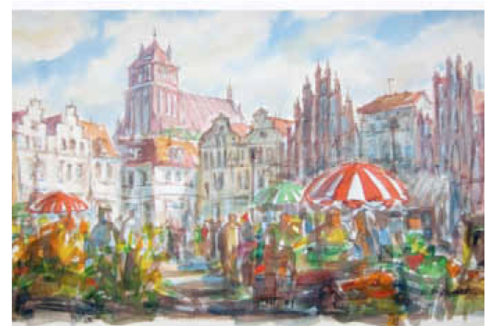
Greifswalder Marktplatz, H. Maletzke

Informationen zum Pommernhus im Netz: www.kunsthalle-pommernhus.de