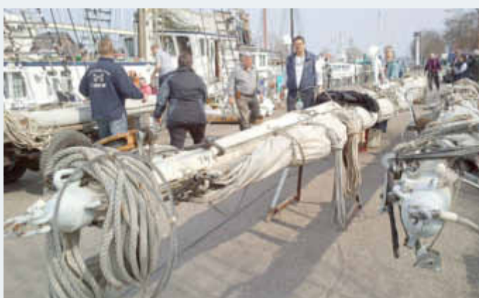
Beim Auftakeln, Foto: Seesportzentrum Greif

Mit dem Auftakeln des Segelschulschiffs GREIF und dem Treideln des Topsegelschoners WEISSE DÜNE beginnt am Sonnabend die maritime Saison 2018. Das Flaggschiff der Universitäts- und Hansestadt Greifswald wird am Sonnabend, dem 7. April ab 8:30 Uhr am Liegeplatz vor dem Majuwi für die Saison vorbereitet. Rund 100 Helferinnen und Helfer aus dem Förderverein Rahsegler Greif e. V. werden die Stammcrew dabei unterstützen. Unter anderem werden die Segel angeschlagen und im Laufe des Vormittags die schweren Rahen wieder an ihre Position am Mast gebracht.