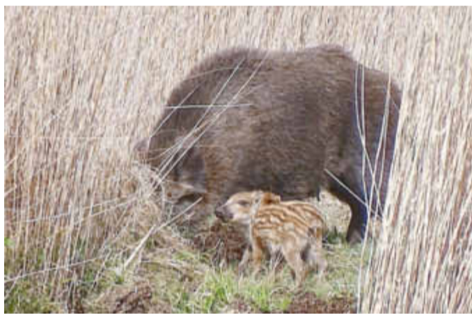
Wildschweine in der Ryckniederung