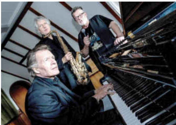
Das Leslie Meier Trio

VIEL GUT ESSEN Ein Stück von Sibylle Berg - Theatermonolog mit Stephan Waak. PREMIERE