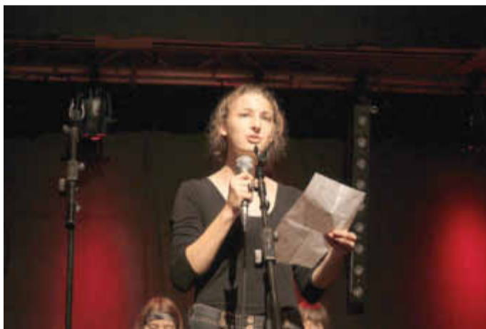
U20 Poetry Slam am 6.

Mitmachangebot des Interkulturellen Cafés, im Rahmen des Greifswalder Literaturfrühlings. Wir spielen gemeinsam mit Sprache und Phrasen. Gedrucktes wird in ganz neue Zusammenhänge gebracht und lässt schönen Nonsens, Verse oder sogar eine Geschichte entstehen. Es kann jeder vorbeikommen und mitmachen. Der Eintritt ist frei. Kuchenspenden sind willkommen und es gibt fair gehandelten Kaffee. (bis 19 Uhr)