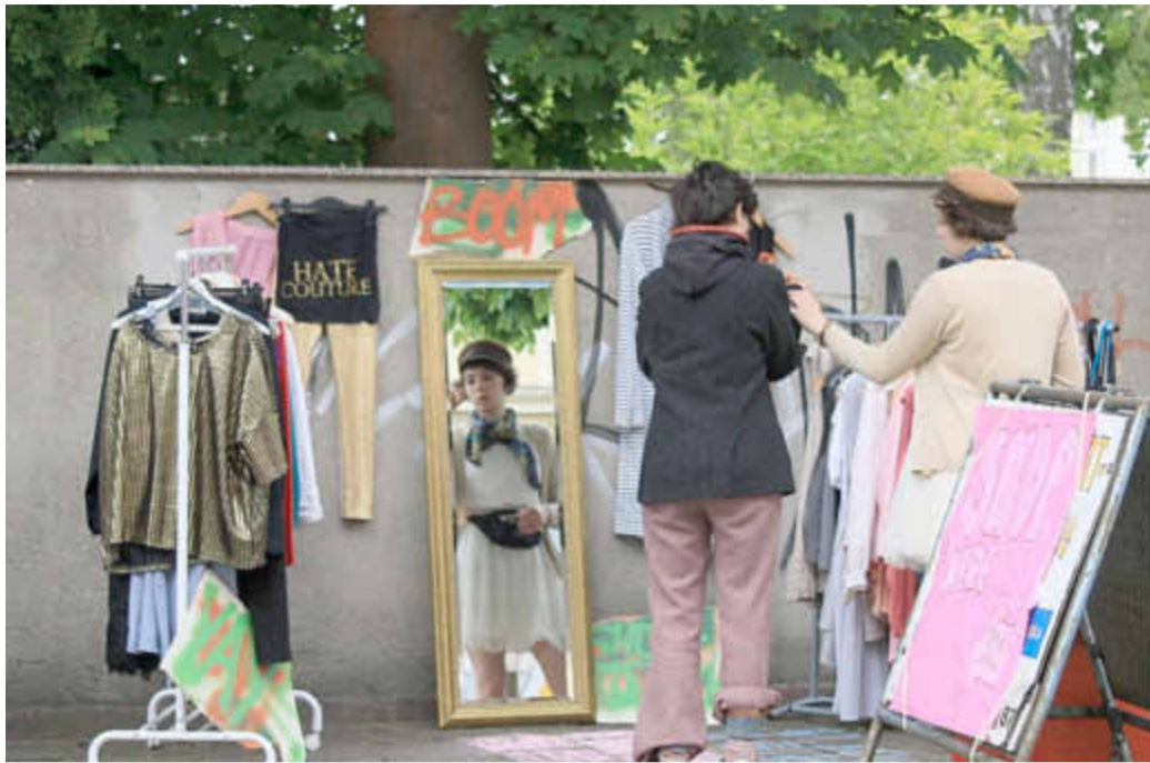
Flohmarkt 2017

Eine offizielle Anmeldung ist wichtig, um Informationen über die Teilnahmebedingungen zu erhalten, die vom Ordnungsamt verlangt werden. Es wird wieder einen Laufplan mit den Ständen geben. Wer sich an der Organisation des Flohmarktes beteiligen möchte,