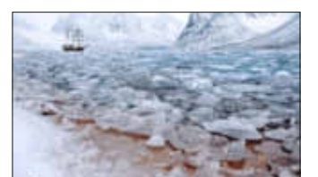
Spuren in Eis und Schnee

Alle Informationen finden Sie unter: www.nordischerklang.de