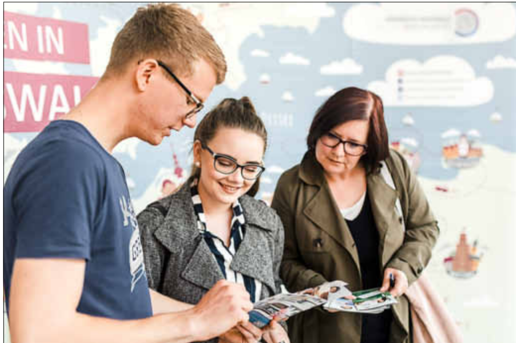
Campusspezialisten stellen das Studienangebot der Universität Greifswald vor.