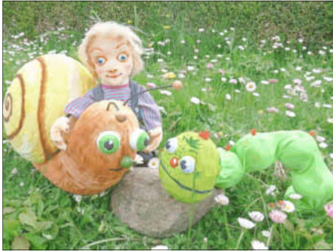
Die kleine Raupe