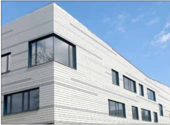
Ersatzneubau der IGS Erwin Fischer