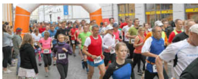
HSG Uni Greifswald

Alle Informationen zur Anmeldung und Teilnahme finden Sie unter: www.citylauf-greifswald.de