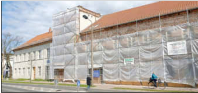
Bauarbeiten in der Stralsunder Straße 10/11