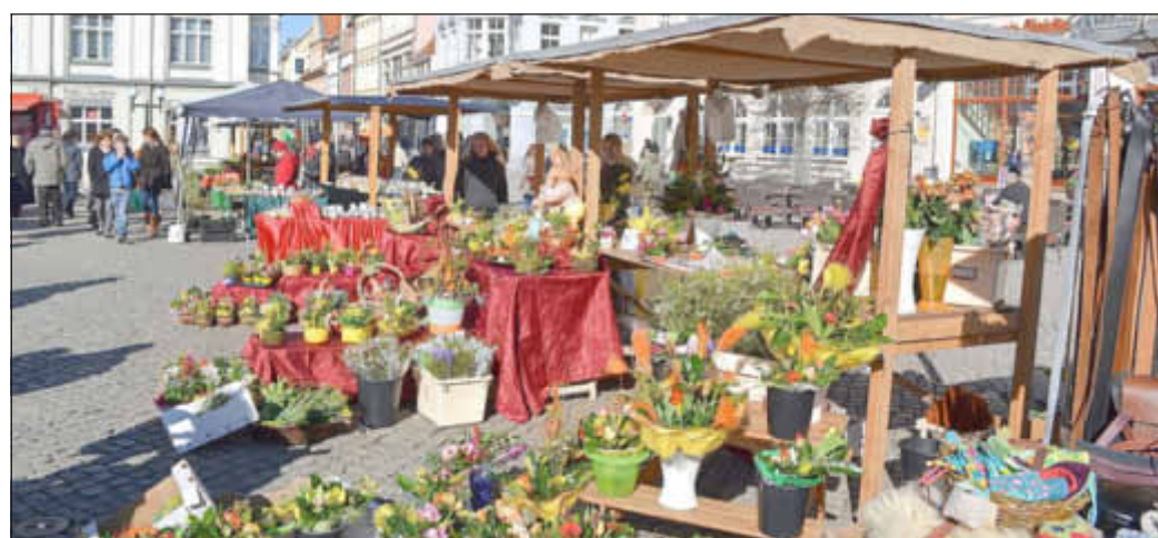
Der Gartenmarkt bietet Gartenpflanzen aus regionalen Baumschulen.

Außergewöhnliche Keramik aus ganz Deutschland bietet der Greifswalder Töpfermarkt am 11. und 12. Mai auf dem Historischen Marktplatz. Besucher können aus einem hochwertigen Angebot verschiedener keramischer Techniken und Produkte wählen. Geöffnet ist der Töpfermarkt am Samstag von 10:00 bis 18:00 Uhr und am Sonntag von 10:00 bis 17:00 Uhr.