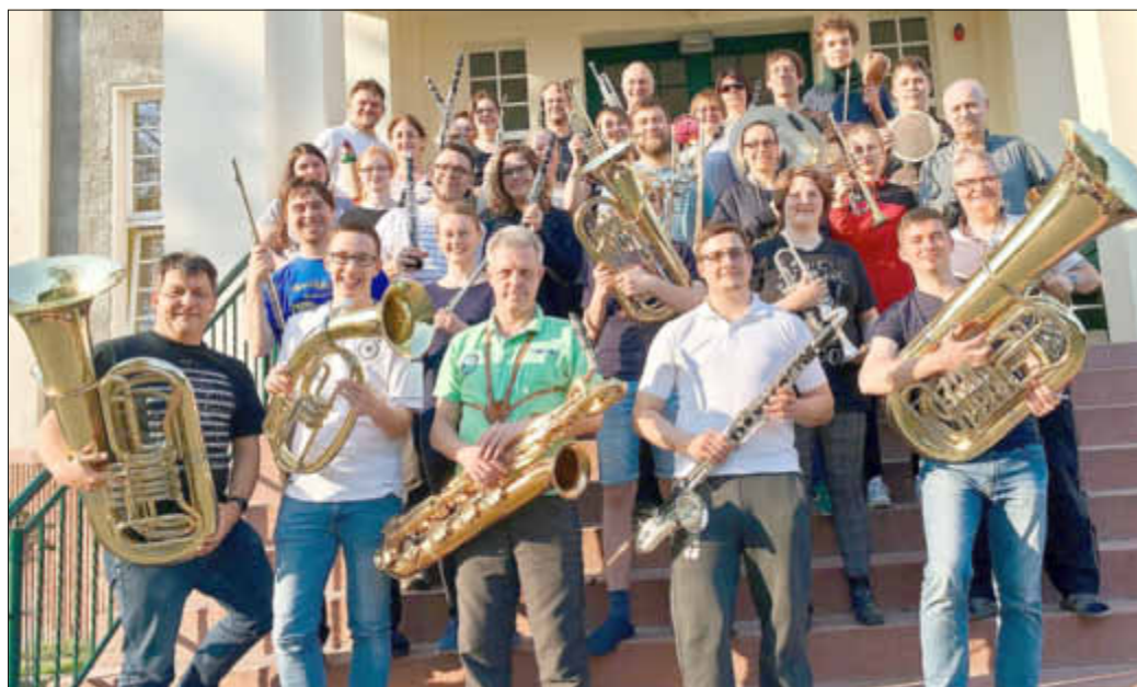
Foto: Gruppenfoto des Blasorchester Greifswald e. V.

Klosterruine gespielt. Eintrittskarten für diesen Konzernachmittag gibt es bereits in der Greifswald-Information am Markt, im Internet unter www.mvticket.de sowie ab 14:30 Uhr der Tageskasse vor Ort.