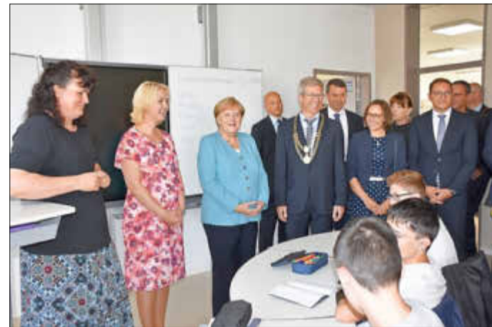
Bundeskanzlerin Dr. Angela Merkel hat sich auf einem Rundgang die Schule angeschaut.