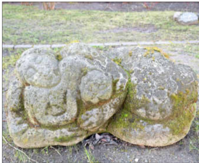
Frau mit Katze

Eine weitere Führung befasst sich ab 14:00 Uhr mit zwei Kunstwerken in der Innenstadt - dem bekannten schwarzen Monolithen am Eingang zum Mühlenort sowie der unbekannteren Sandsteinskulptur Frau mit Katze zwischen Schuhhagen und Loefflerstraße.