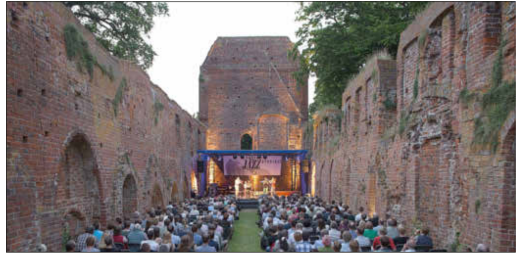
Eldenaer Jazz Evenings 2015

„Wir freuen uns dafür umso mehr, dann im kommenden Jahr die Jazz-Fans aus nah und fern begrüßen zu dürfen“ resümiert