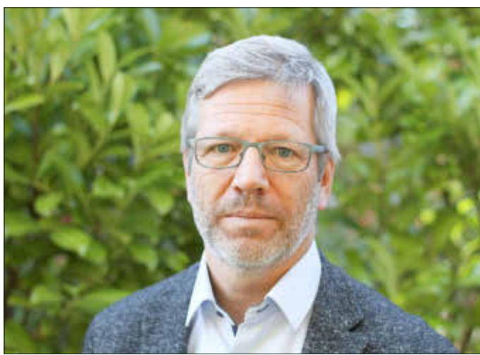
Oberbürgermeister Dr. Stefan Fassbinder

Sie alle werden verfolgt haben, dass sich die Corona-Fallzahlen, die Zahl der Patienten, die medizinisch betreut werden müssen, in Greifswald auf einem vergleichsweise niedrigen Niveau bewegen. Dies ist vor allem auch Ihrer