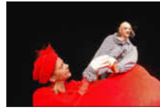
Theater Maskotte, Schöner Leiden

20:00 • FANTAKEL im St. Spiritus Schöner Leiden - eine Couch packt aus | Theater Maskotte Figurentheater für Erwachsene