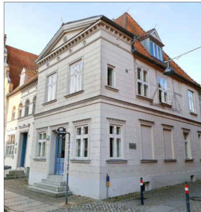
Die Baderstraße 1 wird in einem Video vorgestellt,

In St. Marien wird in einer digitalen Führung durch André Lutze die Annenkapelle genauer betrachtet.