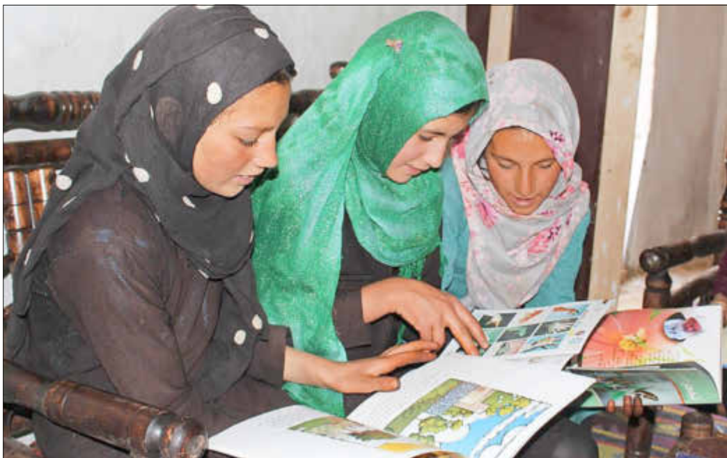
Lesende Mädchen in der 2019 eröffneten Bibliothek Salangs

Bitte informieren Sie sich in der Presse, der städtischen Internet- und Facebook-Seite zum aktuellen Stand und Terminen.