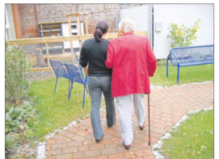
Neben einer guten medizinischen und therapeutischen Versorgung und Pflege für Menschen mit Demenz benötigen auch die Angehörige Beratung, Hilfe, Austausch, Verständnis, Ermutigungen und Entlastung.

Mittwoch, 7. April 2021 Wohnraumanpassung - Orientierung, Sicherheit, Hilfsmittel und Beschäftigung