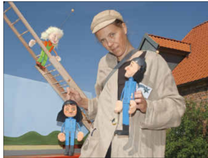
Puppenspiel „Bei der Feuerwehr wird der Kaffee kalt“