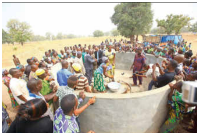
Einweihung eines Trinkwasserbrunnen

Öffnungszeiten: Montag - Donnerstag 8:00 - 18:00 Uhr | Freitag 8:00 - 15:30 Uhr