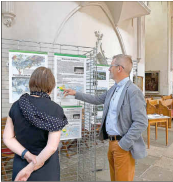
Ausstellung „Mayors for Peace“ im Greifswalder Dom

Im Februar 2020 trat die Stadt Greifswald dem weltweiten Netzwerk Mayors for Peace bei. Mit der diesjährigen Plakatausstellung, zusammen mit dem Begehen des Flaggentages am 8. Juli und dem Läuten der Friedens- und Kirchenglocken am 6. August, soll ein Zeichen für eine Welt ohne Atomwaffen gesetzt werden. Die Ausstellung im Greifswalder Dom St. Nikolai zeigt die Auswirkungen und Zerstörung durch die Atombomben, die im August 1945 auf Hiroshima und Nagasaki abgeworfen wurden. Eindrucksvolle Plakate machen auf die Folgen aufmerksam und rufen dazu auf, sich gemeinsam gegen Atomwaffen einzusetzen. Geöffnet ist die Ausstellung vom 14. Juni bis zum 14. Juli 2021. Gemeinsam gegen Atomwaffen: