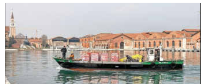
Torfmoose gondeln durch Venedig

für den Klimaschutz bedeuten und wie sich nasse Moore in einer nachhaltigen Form der Landwirtschaft (Paludikultur) nutzen lassen. Mit 250 Kisten lebenden Torfmoosen im Gepäck reiste die Künstlerin anschließend nach Venedig. Jetzt baut sie - inspiriert von der Moorexpertise aus Greifswald und dem künstlerischen Erbe Caspar David Friedrichs - an einem Moor-Klima-Kunstwerk in der Wasserstadt.