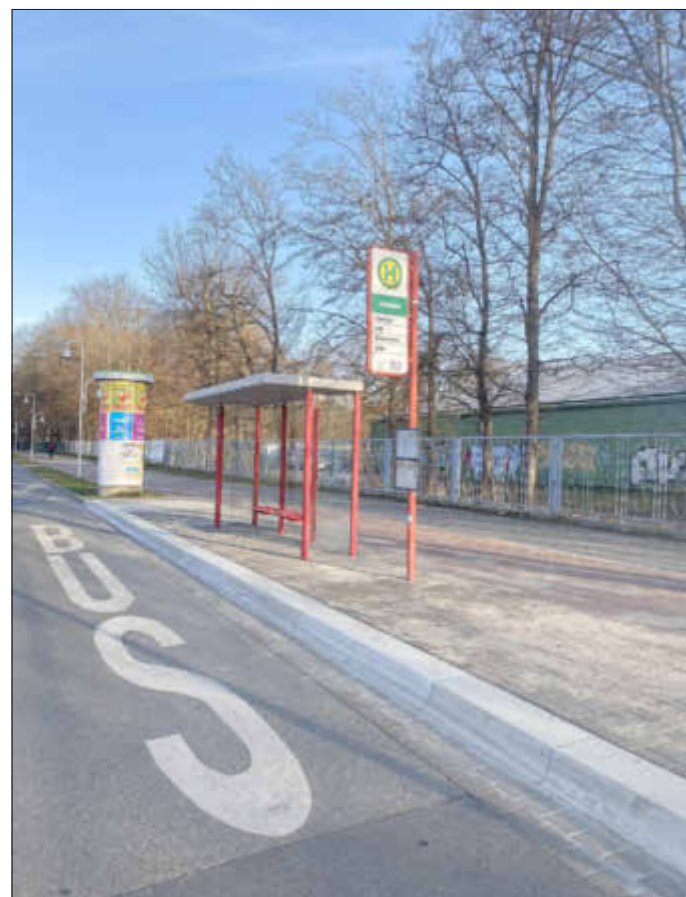
Barrierefreie Bushaltestelle am Freizeitbad

Orte vermittelt, die noch kein eigenes Programm haben. Unter Berücksichtigung der COVID-19-Pandemie und in Anbetracht der sich ändernden Rahmenbedingungen für Veranstaltungen sind auch in diesem Jahr wieder Online-Angebote willkommen. Das bedeutet allerdings nicht, dass die Kulturnacht, so der aktuelle Stand, lediglich im digitalen Raum durchgeführt werden soll. Vielmehr werden alle Veranstalter*innen bereits jetzt dazu aufgerufen, Ihre Vor-Ort-Veranstaltungen notfalls auch digital zu denken. Anmeldungen als Künstler*in bzw. als Mitveranstalter*in/ Veranstaltungsort sind auf der Internetseite www.greifswald.de/kulturnacht möglich.