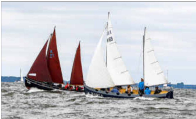
Regatta der ZK10-Kutter

Ein weiteres maritimes Highlight wird die Spezialdisziplin des Seesportes, die Regatta der ZK10-Kutter sein. Mannschaften aus Deutschland kämpfen um den Sieg in der Dänischen Wieck. Viele Teams segeln auf Kuttern, die aus Kunststoff gefertigt wurden, doch laufen auch einige sanierte historische Holzkutter aus: 7,50 Meter lang, 2,15 Meter breit und eine Tonne schwer. Auf solchen Kuttern wurden einst Matrosen ausgebildet. Die Kutter sind ein-