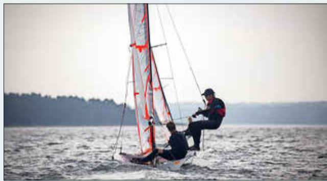
Auf die Segler

Donnerstag, 14. März, 17 Uhr Ausstellungseröffnung „Auf die Segler“ Fotografien von Prof. Dr. med. Sönke Langner