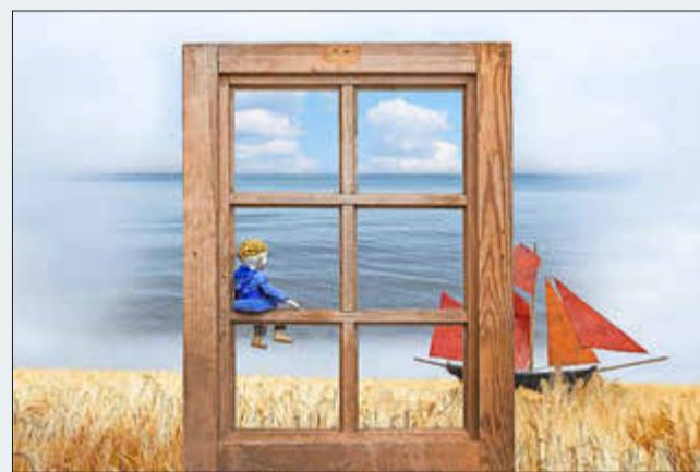
Casper-Guck-in-die-Welt, SCHNUPPE-Figurentheater

Doppelpremiere - Kindertheater zu Caspar David Friedrich - für Kinder ab 5 Jahren