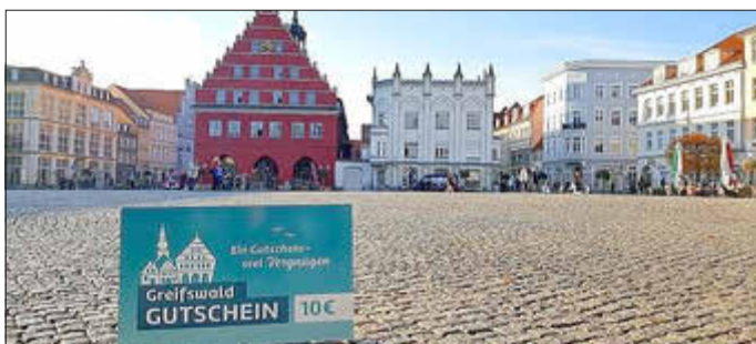
Greifswald-Gutschein, Foto: Theres Behnke

1.116.000 €, über 83.000 Gutscheine, 140 Partner - das ist die aktuelle Zwischenbilanz nach 3 Jahren Greifswald Gutschein. Im November 2020 ging das System mit rund 60 Partnern an den Start; mittlerweile beteiligen sich 140 Händler und Unternehmen. Damit ist es das größte Stadtgutschein-System in ganz MV. Der Greifswald Gutschein ist in den verschiedensten Branchen einlösbar. Egal ob Gastronomie, Einzelhandel, Freizeit oder Kultur-für