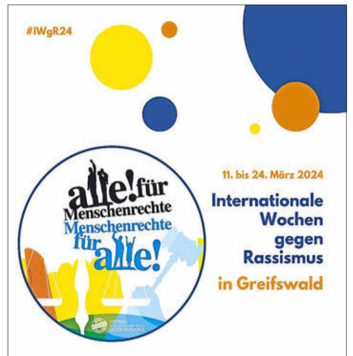
Das komplette Programm finden Sie in der Rubrik: Information der Verwaltung.

Ansprechpartner: Universitäts- und Hansestadt Greifswald Stadtbauamt, Abteilung Geoinformation und Vermessung E-Mail: mietspiegel@greifswald.de Tel. 03834 8536-4173