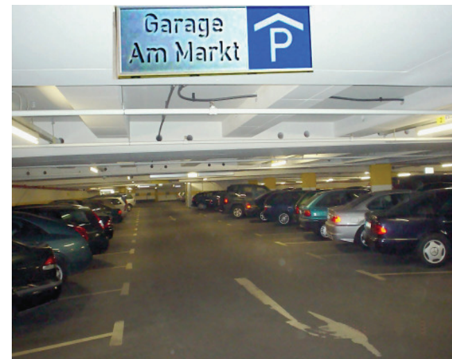
Eröffnung der stützenfreien benutzerfreundlichen Tiefgarage Am Markt mit 273 Stellplätzen am 30.10.2003

mit Neuregelungen (Stufe 2) gemäß Bürgerschaftsbeschluss vom 16.02.2004