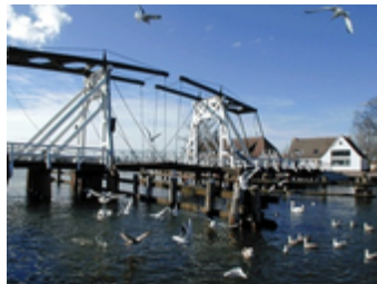
Wiecker Brücke