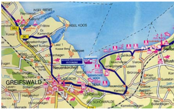
Radkarte Ostseeküstenradweg Greifswaldroute, weiter dann ins Umland bis nach Kemnitz-Loissin