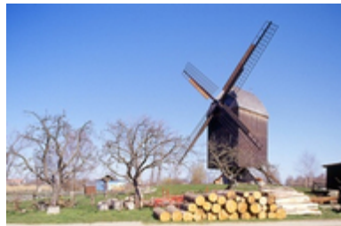
Bockwindmühle Eldena

Wegstrecke: von der Steinbecker Brücke auf dem Treidelpfad auf einer sehr schönen ruhigen Strecke am Si bis ins Fischerdörfchen Greifswald-Wieck