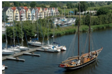
Wohnen am Wasser, Foto: Peter Binder