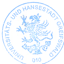
Egbert Liskow Präsident der Bürgerschaft

Anlage 2 Vollständigkeitserklärung öffentlich