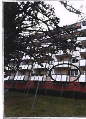
Ansicht Süd (Lage der Wohnung)

An die Gerichtsstafel angeheftet am: abgenommen am: