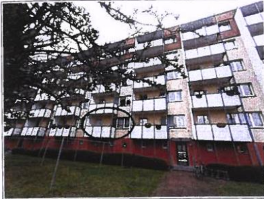
Ansicht Süd (Lage der Wohnung)