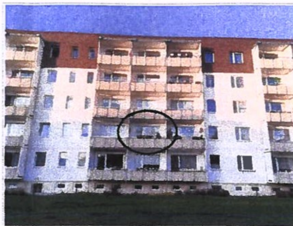
Hofansicht (Südseite), Lage der Wohnung