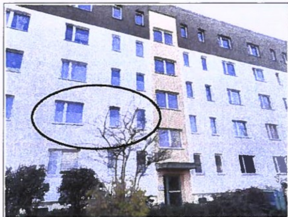
Straßenansicht (Nordseite), Lage der Wohnung