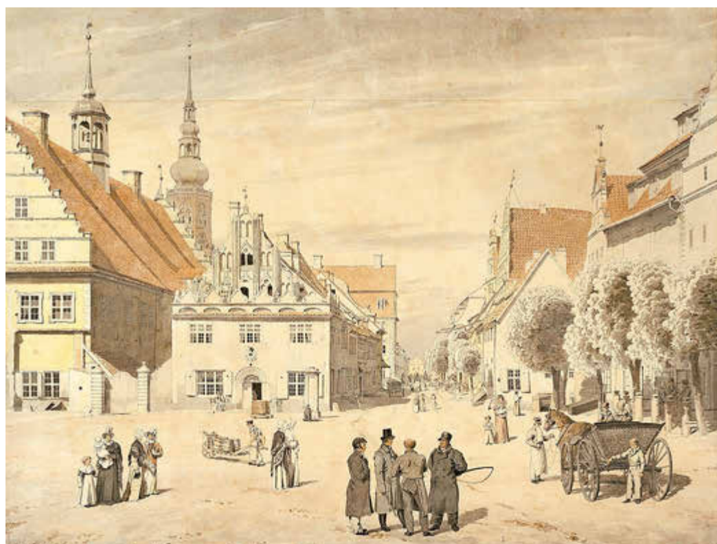
Caspar David Friedrich, Der Greifswalder Marktplatz, 1818 , Pommersches Landesmuseum. (1818 - Greifswald und die Familie Friedrich)

Kommen Sie einfach im schicken, weißen Outfit dazu, bringen einen Klappstuhl für sich und Ihre Gäste mit, dazu eine weiße Tischdecke, Stühle und Verpflegung. Zugunsten unserer sozialen Projekte, die Frauen und Kinder unterstützen, sammeln wir eine Spende von 12 Euro pro Tisch ein. Freuen Sie sich auf interessante Menschen und Gespräche.