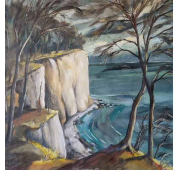
"Hommage an CDF" Jörg Korkhaus