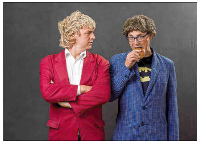
Zärtlichkeiten mit Freunden