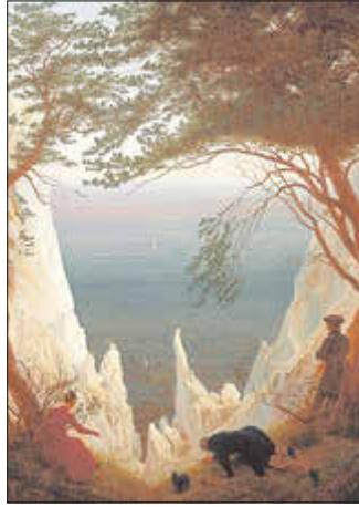
Caspar David Friedrich, Kreidefelsen auf Rügen, 1818

die Sparkasse Vorpommern! Danke! Eintritt frei