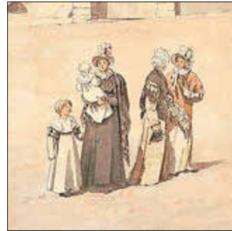
Caspar David Friedrich, Der Greifswalder Markt, 1818 (Auschnitt), Pommersches Landesmuseum

VON KLIPPEN UND KÜSTEN Mi, 21.08.24, 17.00 Uhr Sa, 24.08.24, 11.00 Uhr Sa, 31.08.24, 11.00 Uhr & 15.00 Uhr Führung zur Ausstellung „Sehnsuchtsorte“ 5,00 € zzgl. Museumseintritt