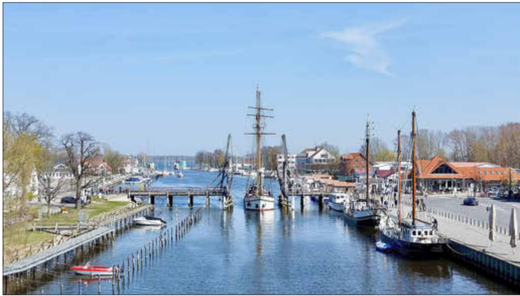
Weiße Düne durchquert die Wiecker Brücke

Ein besonderes Erlebnis wird der Treidelzug sein: ab etwa 14 Uhr wird die „Weiße Düne“ – wie früher – mit Muskelkraft vom Museumshafen über den Ryck nach Wieck gezogen. Diese historische Praxis war einst nötig, weil Schiffe auf dem engen Wasserweg ohne Wind oft nicht allein segeln konnten. Ergänzend zu Markt und Treideln bieten