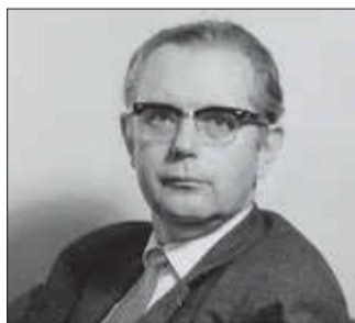
Rudolf Biederstedt © Stadtarchiv Greifswald.

Eine große Anzahl an Publikationen zeigen Biederstedts nachhaltiges, vielfältiges und tiefes Interesse an der Geschichte Greifswalds und Vorpommerns.