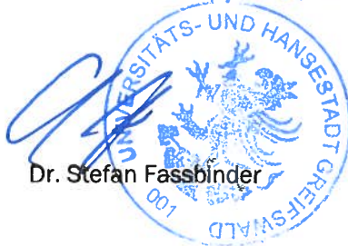
Dr. Stefan Fassbinder

Soweit beim Erlass dieser Satzung gegen Verfahrens- oder Formvorschriften verstoßen wurde, können diese entsprechend § 5 Abs. 5 der Kommunalverfassung M-V nach Ablauf eines Jahres seit dieser öffentlichen Bekanntmachung nicht mehr geltend gemacht werden. Diese Einschränkung gilt nicht für die Verletzung von Anzeige-, Genehmigungs- oder Bekanntmachungsvorschriften.