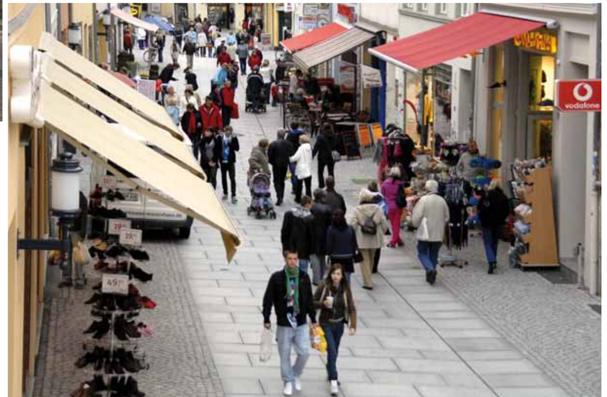
Der Schuhhagen vor (oben) und nach der Sanierung