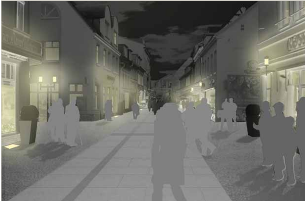
Der neue Schuhhagen bei Nacht. Visualisierung durch das Büro Lohrer.Hochrein, Magdeburg