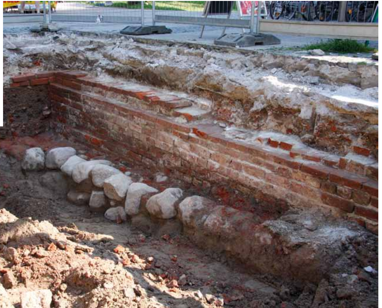
Rechts: Feldsteinfundamente und Ziegelmauerwerk des historischen Mühlentores