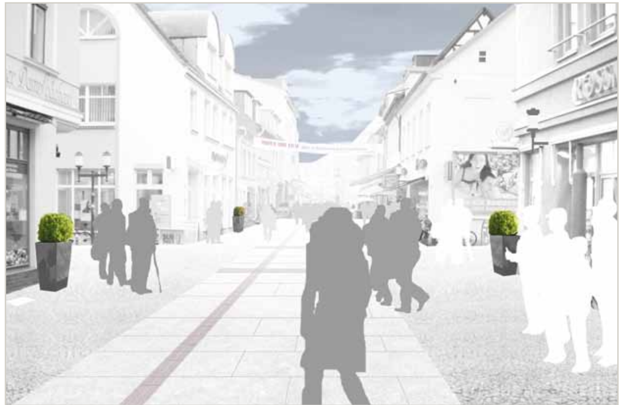
Der neue Schuhhagen bei Tag. Visualisierung durch das Büro Lohrer.Hochrein, Magdeburg